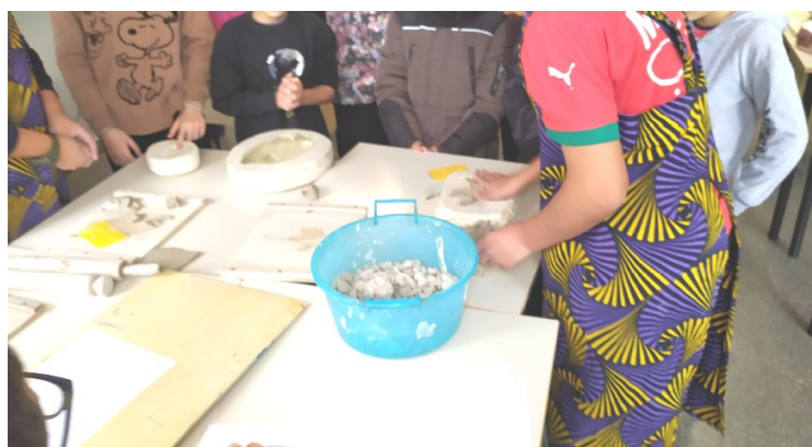
Laboratorio di arte